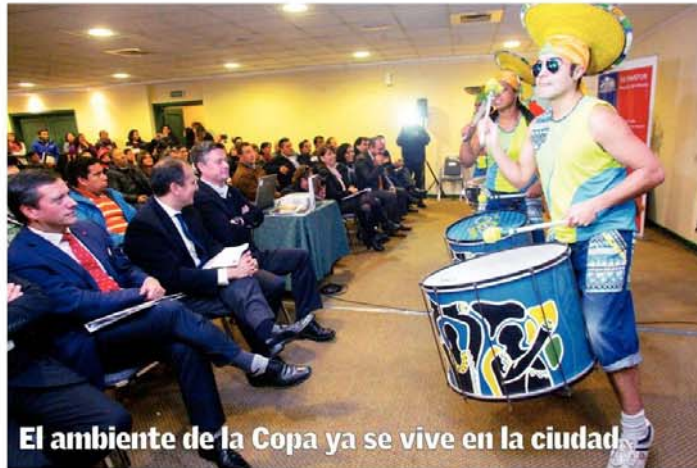
El ambiente de la Copa ya se vive en la ciudad.

► Intendente y alcalde encabezaron ceremonia de certificación de trabajadores capacitados para el evento deportivo.